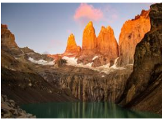
Torres del Paine 📍 - ⌚ 2h 30m Mirador Base Las Torres 📍