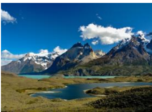
Mirador Base Las Torres 📍 25km Vallée du Français 📍